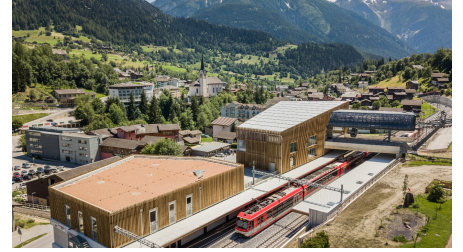
oev-Hub Fiesch - © @aletscharena.ch / Pascal Gertschen - third parties editorial and touristic use only