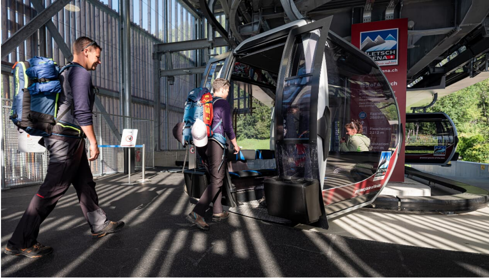
10er Gondel im oev-Hub in Fiesch