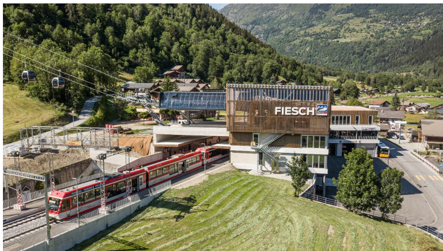
öev-Hub Fiesch - © ©aletscharena.ch / Pascal Gertschen - third parties editorial and touristic use only